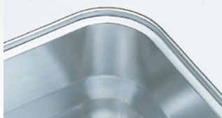
大型コーナーアール

オールステンレス製でシンプル設計。子どもたちがすくい易くて、調理員さんは洗い易い大型コーナーアール。