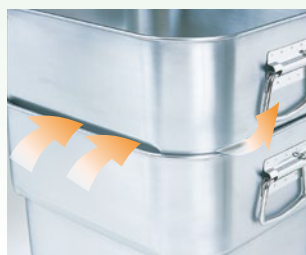
コーナー・側面部リブ加工