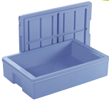
蓋はプレス製に変更 (300-16・300-16Fc・300-16F)