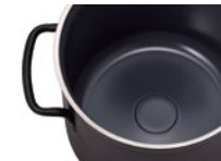
■内面セラミック塗膜加工