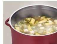
■味噌汁やうどんなどの汁物に