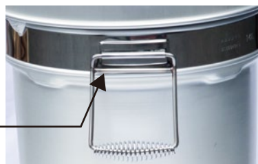
③段付二重食缶RC用中蓋パッキン表