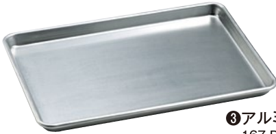
③アルミシートパン ハーフ 日本製 167-D 456×328×25mm ¥5,450 167-DD 456×328×50mm ¥6,700 ●φ6mm鉄芯(ニッケルメッキ)入 ●板厚1.0mm ●材質:アルミニウム