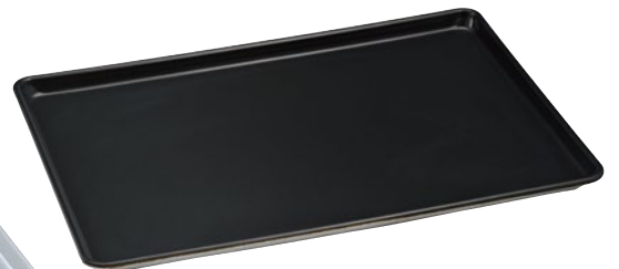
⑦ノンスティックアルミシートパン 日本製 167-Q1 657×456×25mm ¥23,500 ●φ6mm鉄芯入 ●板厚1.2mm ●材質:シルバーアルマイト+フッ素加工

アルミホテルパンにアルマイト加工。 ホテルパン表面の腐食や黒変化を防ぎます。 重量はステンレスの約1/2です。