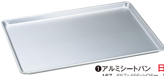
①アルミシートパン 日本製 167 657×456×H25mm ¥9,100 ●φ6mmアルミ芯入 ●板厚1.2mm ●材質:シルバーアルマイト