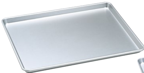
⑤アルミシートパン 日本製 167-B 550×456×25mm ¥10,500 ●φ6mmアルミ芯入 ●板厚1.2mm ●材質:シルバーアルマイト