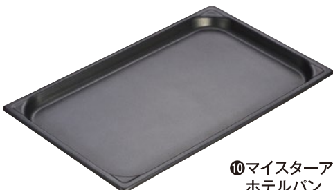
⑩マイスターアルミ ノンスティックホテルパン ●材質:内面フッ素樹脂加工/板厚:1.2mm