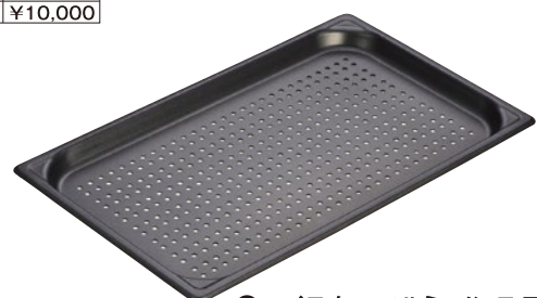
⑪マイスターアルミ ノンスティック穴明ホテルパン ●材質:内面フッ素樹脂加工/板厚:1.2mm