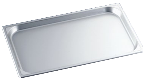
⑧マイスターアルミホテルパン ●材質:シルバーアルマイト/板厚:1.2mm

アルミホテルパンにアルマイト加工。 ホテルパン表面の腐食や黒変化を防ぎます。 重量はステンレスの約1/2です。