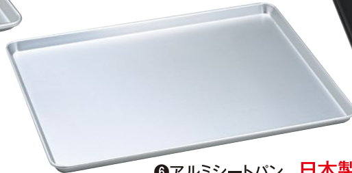
⑥アルミシートパン 日本製 167-C 650×520×25mm ¥12,300 ●板厚1.2mm ●材質:シルバーアルマイト