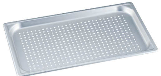
⑨マイスターアルミ穴明ホテルパン ●材質:シルバーアルマイト/板厚:1.2mm