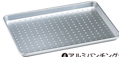
④アルミパンチングシートパン ハーフ 日本製 167-DA 456×328×25mm ¥7,800 ●φ6mmアルミ芯入 ●板厚1.0mm ●材質:シルバーアルマイト